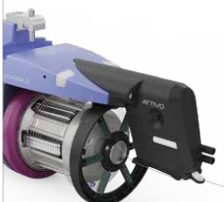
0 a 50 Attivo