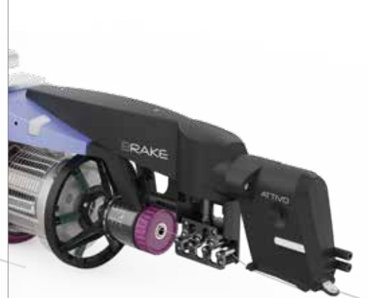
0 a 200 Brake