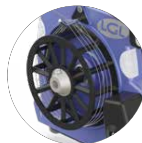
Per fili elastici

Applicazioni principali Macchine circolari a grande diametro, orditoi