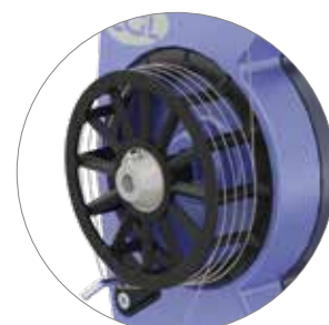
Per fili elastici